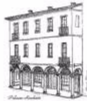
Biblioteca Civica Farinone Centa